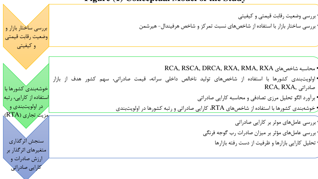
شکل (۱) الگوی مفهومی بررسی Figure (1) Conceptual Model of the Study

ساختار بازار صادراتی رب گوجه فرنگی در این بررسی دو شاخص نسبت‌های تمرکز (CR) و هرفیندال-هیرشمن (HHI) مورد مطالعه قرار خواهد گرفت. شاخص نسبت تمرکز بیانگر آن است که تولید محصول در تمرکز چند کشور بوده و همچنین می‌تواند انواع ساختار دیگر بازارهای بین رقابت کامل و انحصار کامل را نشان دهد. شاخص بالا را می‌توان به صورت رابطه (۱) تعریف کرد (Brasili et al., 2000):